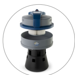
Ultra FilterRing System