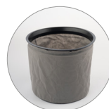
TNT filter (optioneel)