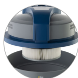
PTFE patroonfilter stofklasse M